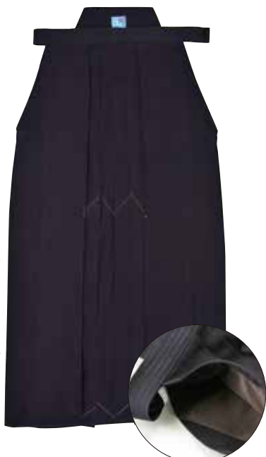
裏地:テクノメッシュ