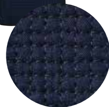
コシ・見た目にもミン糸で 手刺の風合いを実現。