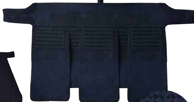
活人 十字刺防具 セット 181,100円+税 ※詳しくはP30をご参照ください。