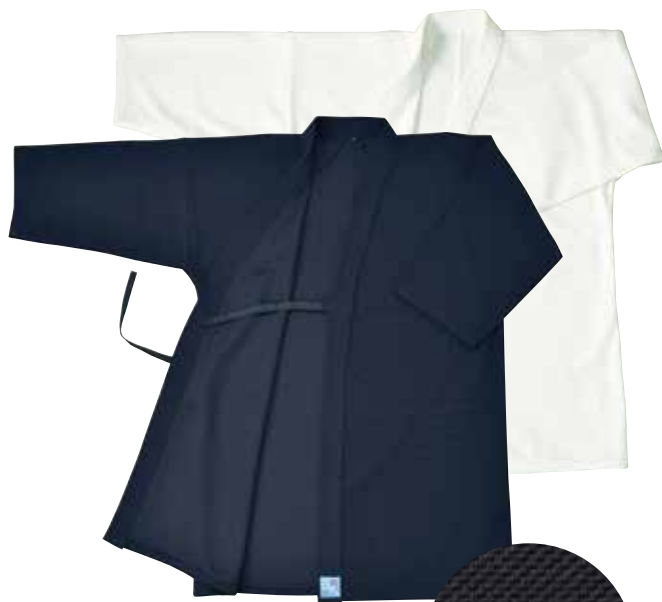
活人 織刺調ジャージ剣道衣 KG500EL(紺)・KG510EL(白) 00号～5号 8,200円+税 ※詳しくはP57をご参照ください。